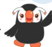
北方領土イメージキャラクター 「エリカちゃん」