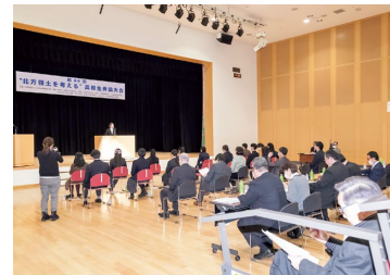
第38回“北方領土を考える”高校生弁論大会

元島民の高齢化が進む中、次代を担う若者たちに北方領土問題や返還要求運動に関心と理解を深めてもらい、国民世論のより一層の高揚を図るため、全道の高校生を対象とした弁論大会を開催し、返還運動後継者の育成を推進します。